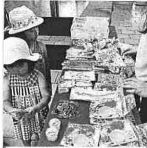
ゲームの後に景品を選ぶ姉妹

七月三十日に、近隣の小学一年生を招待して開催する「夏休み子どもゲーム大会」に併せ、「こどもいちば食堂」をプレオープンし