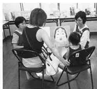
読み聞かせを聞く親子

普段は会議室として使用している同市場別館を、八月二十一日(火)から二十四日(金)の午前十時から午後四時(初日は午前一時から午後五時)までを出張図書館に